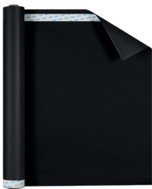
Majvest ® 700 SOB