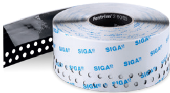
Fentrim® 2 50/85