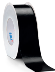
Wigruv ® black