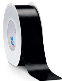
Wigluv ® black