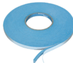
Primur ® rouleau