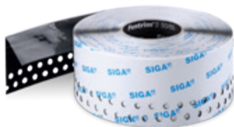
Fentrim ® 2 50/85