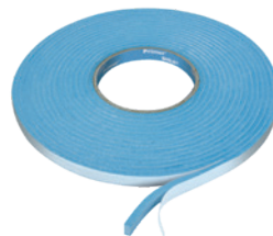
Primur ® rouleau