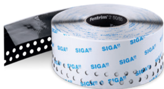
Fentrim ® 2 50/85