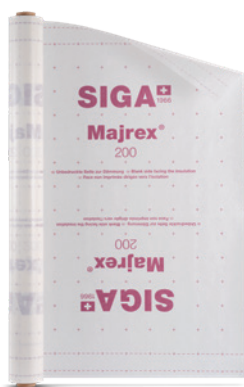
Majrex ® 200