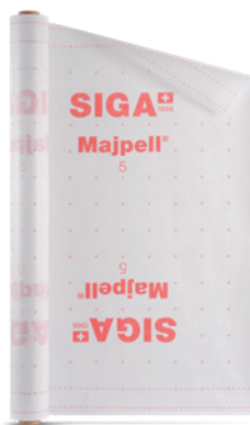
Majpell ® 5