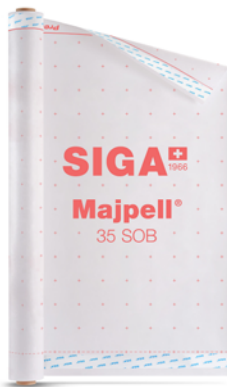
Majpell® 35 SOB

0.14 \text{ m} / 0.040 \text{ W/mK} = 3.5 \text{ m}^2 \text{ K/W}