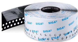
Fentrim® 2 50/85