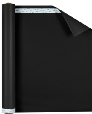
Majvest ® 700 SOB