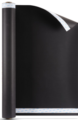
Majvest® 700 SOB