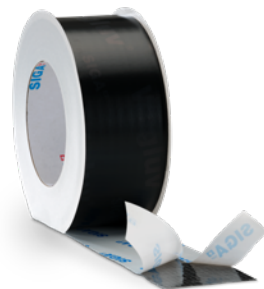
Wigluv® black 20/40