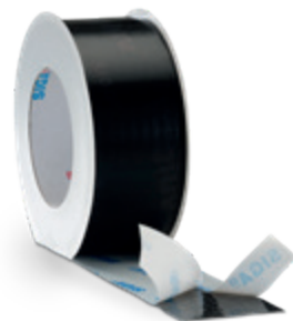
Wigluv® black 20/40