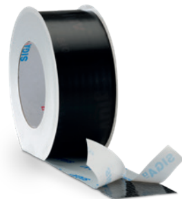
Wiglulv® black 20/40